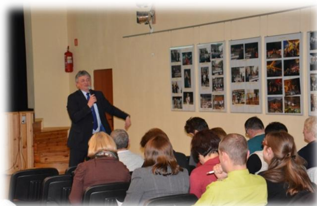
Konsultacje społeczne – Gmina Lelów