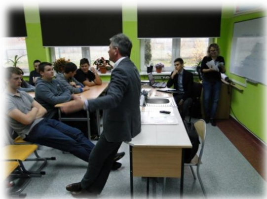
Konsultacje społeczne – Gmina Jerzmanowa